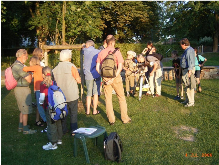
Abb. 3 Planetenwanderung im Sommer. Die Abendwanderung beginnt wie immer an der „Sonne“. Da die natürliche Sonne aber noch über dem Horizont steht, wird mit der Beobachtung am Teleskop im weißen Licht begonnen. Im rechten Teil des Bildes ist das Teleskop erkennbar