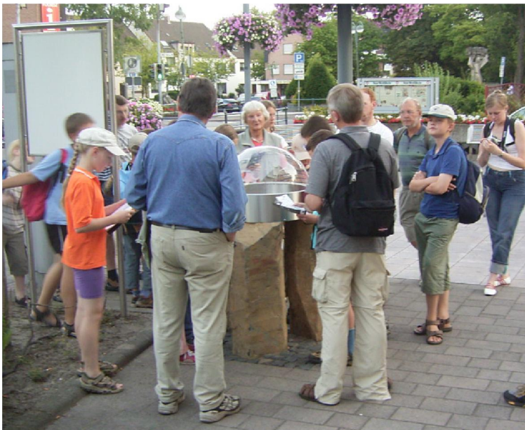
Abb. 4 Erklärungen an der Planeten-skulptur des Mars

Wir sprechen mit diesen Aktivitäten nicht nur ausschließlich astronomisch interessierte Menschen an. Wanderer und andere Freizeitsportler gehören ebenfalls zu unseren Gästen.