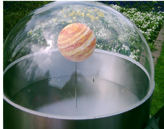
Abb. 2 Der Jupiter mit seiner struktur-reichen Oberfläche