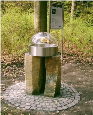
Abb. 1 Die Planetenskulptur des Saturn